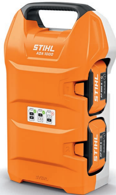
Livré sans batterie