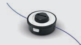
AUTOCUT C 3-2 Réf. : 4009-710-2100