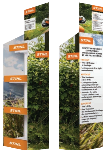
PLV livrée nue. Limité à un présentoir par point de vente.

Offre fils valable au point de vente pour la pré-saison et le réassort, du 1 er Janvier au 31 Juillet